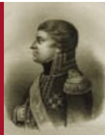
kronprins i 1809, men døde allerede sommeren året etter. Sverige valgte senere den franske generalen Charles-Jean Bernadotte til ny kronprins