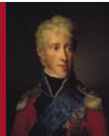
T.v. Fredrik VI, konge 1808–1814

14. august 1814 ga kong Kristian Fredrik likevel etter for overmakten, men i konvensjonen i Moss fikk vi beholde den nye Grunnloven. Dét var en halv seier for Norge!