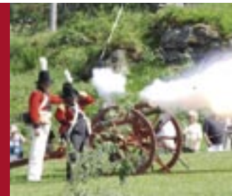
T.h.: Fra et arrangement på Sverresborg i Trondheim sommeren 2007

Andre steder gikk det atskillig bedre for de norske troppene enn ved Lier. Godt kjent er stridene ved Trangen ved Flisa 25. april, ved Prestebakke i Østfold 10. juni og ved Berby, også det i Østfold, 12. september. Felttoget i 1808 var en seier for den norske hæren