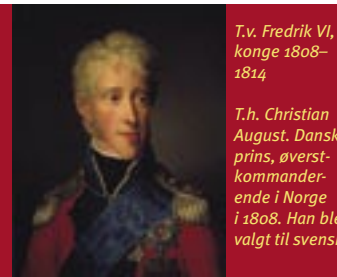
T.v. Fredrik VI, konge 1808–1814

14. august 1814 ga kong Kristian Fredrik likevel etter for overmakten, men i konvensjonen i Moss fikk vi beholde den nye Grunnloven. Dét var en halv seier for Norge!